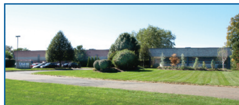
APS公司的总部位于康涅狄格州的沃灵福德镇

APS为世界各地客户提供设计和性能都值得信赖的油田服务产品。我们有着经验丰富的工程师、技师、工具师和机械师制造着世界最先进可靠的机电、仪器和探测设备供客户在环境严苛的油田上使用。